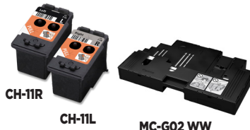
Cabezales y kit absorbedor de tinta fáciles de reemplazar