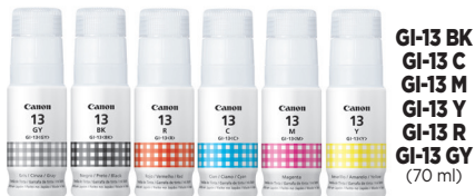
Botellas de tinta de alto rendimiento